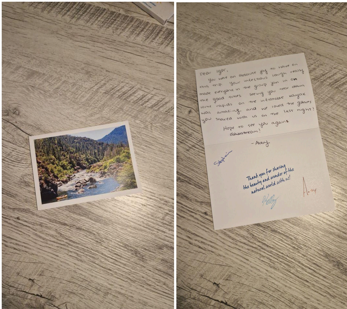
Открытка от Абигейл

Это было важное время для меня. Наконец-то я почувствовал, что готов рассказать свою историю, написать эту книгу и расставить все точки над «и» в своей жизни. Я устал от того, что в моей голове постоянно крутится огромное количество недопониманий, связанных с разными людьми на протяжении всей моей жизни. Эти недопонимания возникали просто потому, что люди не знали о том огромном опыте, который я прошёл, и делали поверхностные суждения. Моя книга — это не просто рассказ о событиях, это моя история, через которую я хочу показать свой путь и объяснить, что стояло за всеми этими встречами, ошибками и решениями. Я хочу, чтобы те, кто знает меня, наконец увидели всю картину, а не только её фрагменты.